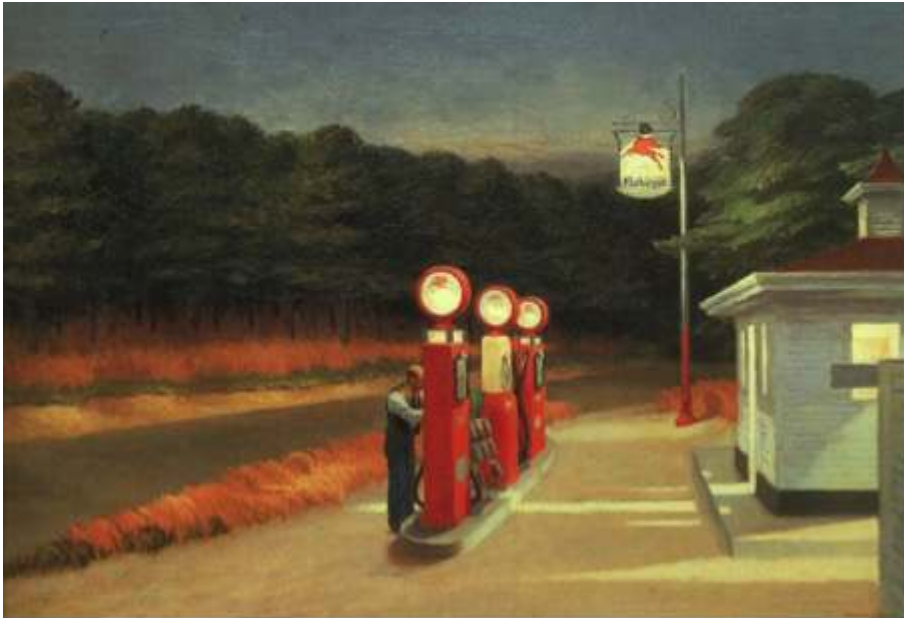
Edward Hopper (1882-1967), Gas , 1940