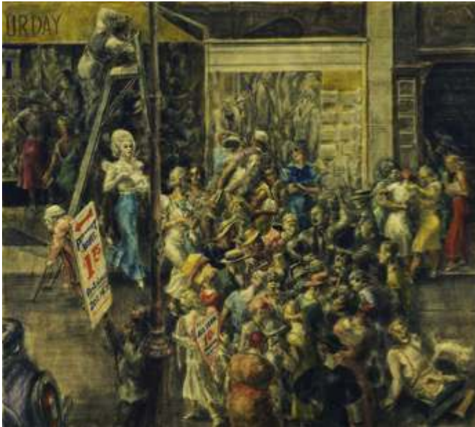
Reginald Marsh (1898-1954), In Fourteenth Street , 1934

Tempera à l'œuf sur panneau, 91.1 x 101 cm