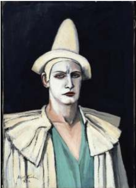
Walt Kuhn (1877-1949), Portrait of the Artist as a Clown (Kansas) , 1932