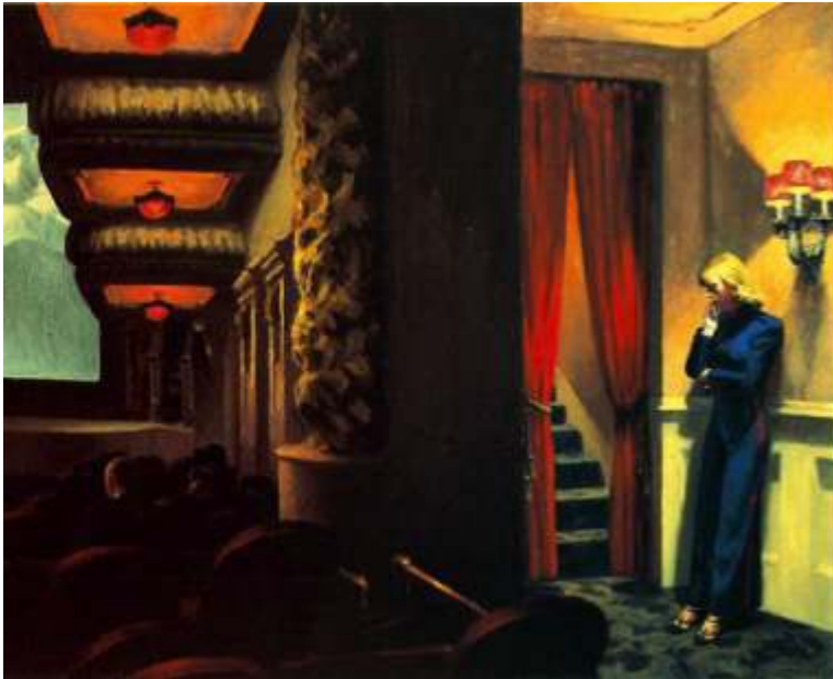
Edward Hopper (1882-1967), New York Movie , 1939

dans une atmosphère de confort feutrée malgré l'âpreté du contexte économique des tableaux. Par ailleurs, l'éclairage tamisé, bien étudié, a le mérite de rendre les tableaux et leur texture très visibles.