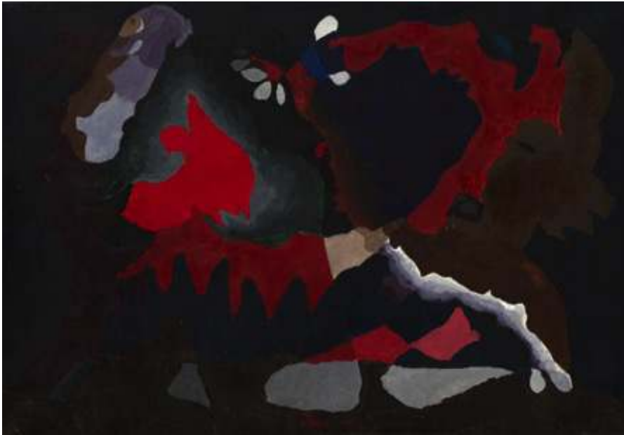
Arthur Dove (1880-1946), Swing Music (Louis Armstrong) , 1938

Emulsion, huile et cire sur toile, 44.8 x 65.7 cm