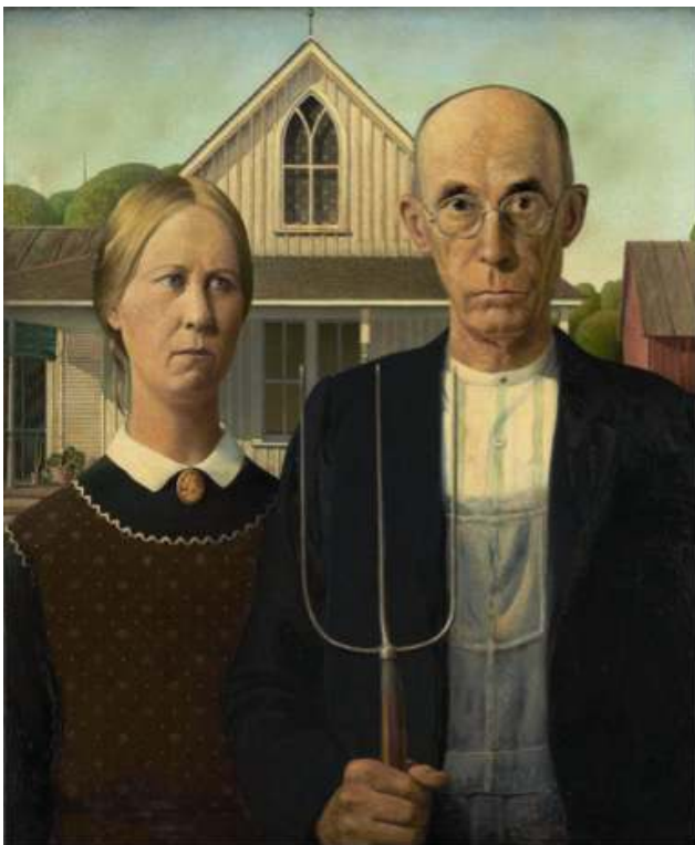
Grant Wood (1891-1942), American Gothic , 1930

Huile sur panneau d'aggloméré, 78 x 65.3 cm