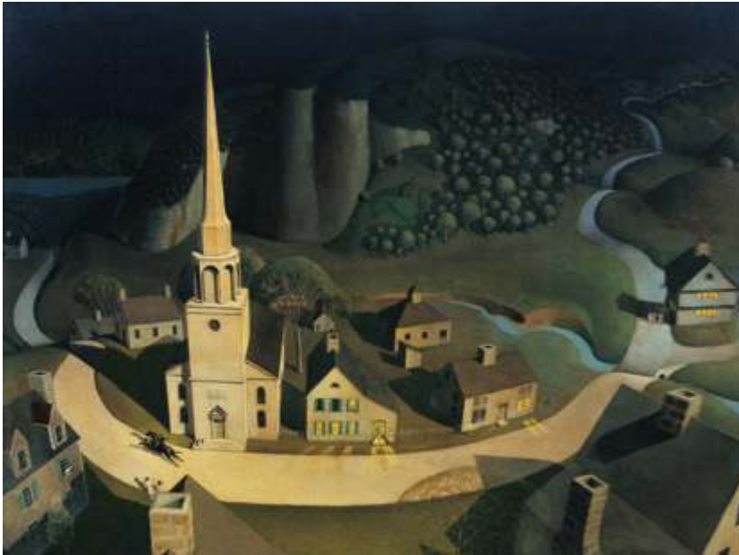
Grant Wood (1891-1942), The Midnight Ride of Paul Revere , 1931