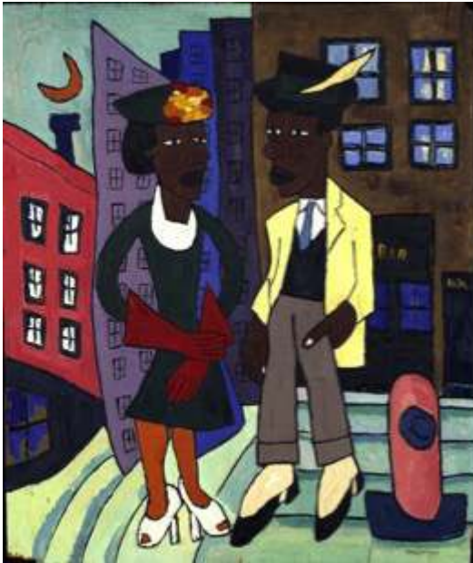
Charles Demuth (1883-1935), ...And the Home of the Brave , 1931

Huile et graphite sur toile, 74.8 x 59.7 cm