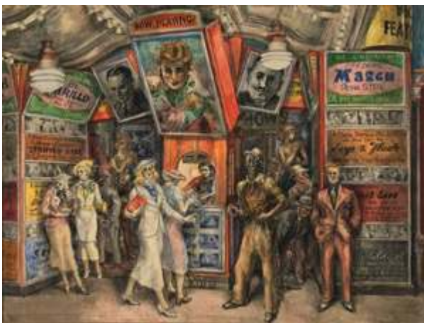
Reginald Marsh (1898-1954), Twenty Cent Movie , 1936

Crayon carbone, encre et huile sur panneau de particules, 76.2 x 101.6 cm