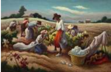
Thomas Hart Benton (1889-1975), Cotton Pickers , 1945

dramatiques de la Grande Dépression. À l'urbanisation, l'industrialisation capitaliste, la « colonisation esthétique » de l'Europe, ils opposent les paysages agraires de l'Amérique profonde, avec ses valeurs protestantes conservatrices, les vertus du travail et de la frugalité. Même les quelques rares paysages colorés de Thomas Hart Benton présentés dans l'exposition sont ondulants, sensuels et souriants, un peu à la manière des dessins animés chez cet homme qui fut un temps cartoonist , et la critique acerbe de ses tableaux, quand critique il y a, ne saute pas aux yeux immédiatement.